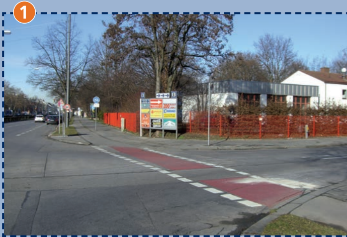
Dachauer Straße/Feldmochinger Straße