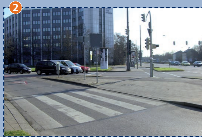
Übergang Georg-Brauchle-Ring/Wintrichring/Dachauer Straße