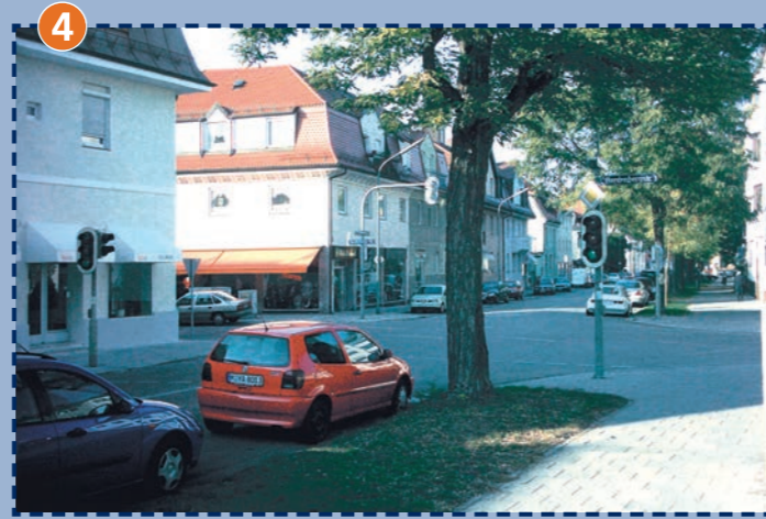
Übergang Feldmochinger Straße in Höhe Hardenberger- und Quedlinburger Straße